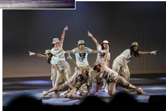
Photos du spectacle Utopia 2023